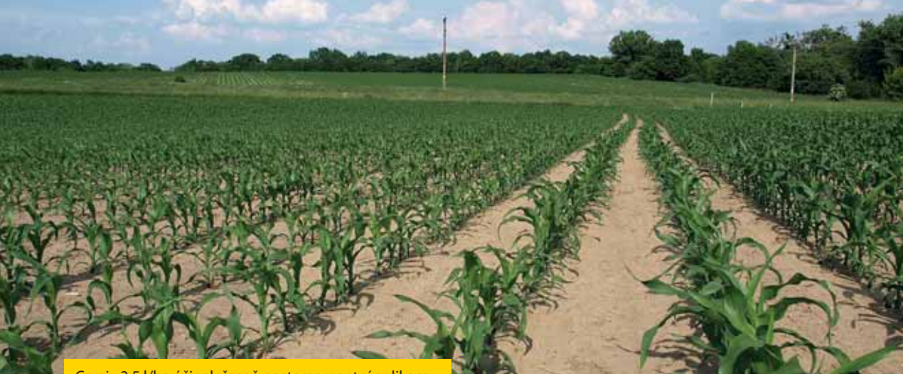
Camix 2,5 l/ha účinek časně postemergentní aplikace