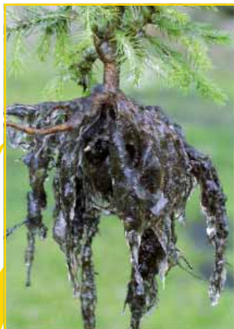
Dokonalá ochrana kořenů