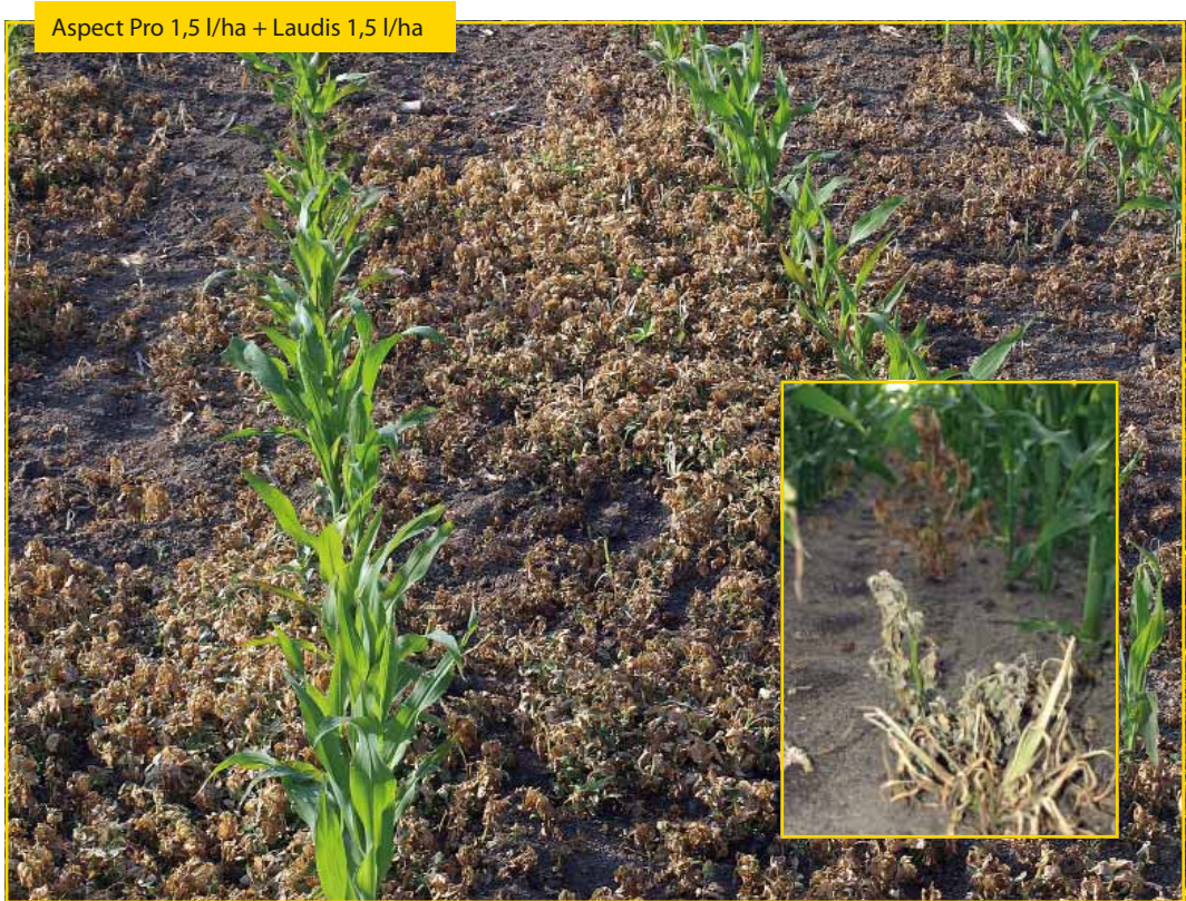
Aspect Pro 1,5 l/ha + Laudis 1,5 l/ha