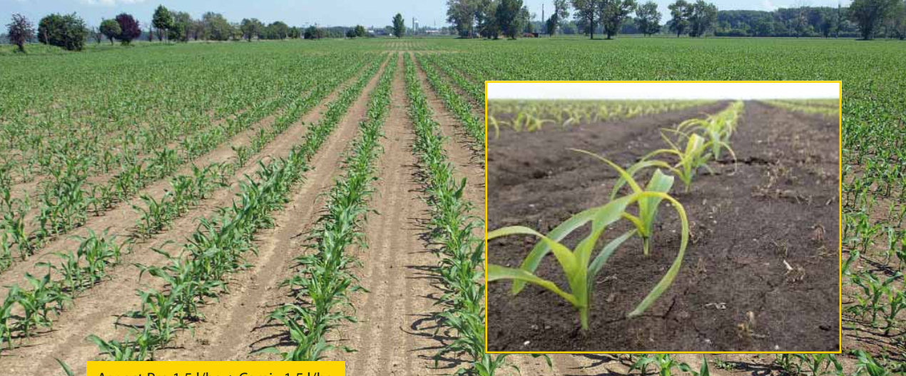
Aspect Pro 1,5 l/ha + Camix 1,5 l/ha

Aspect Pro je selektivní herbicid pro základní ošetření kukuřice proti širokému spektru jednoletých dvouděložných a některých jednoděložných plevelů. Optimální termín pro aplikaci přípravku je po výsevu kukuřice, před vzejitím plevelů, kdy je kukuřice velmi citlivá na zaplevelení v raných růstových fázích a na konkurenci plevelů reaguje silným snížením výnosů. Aspect Pro vyniká dlouhodobým půdním účinkem, který je důležitý pro zabezpečení bezplevelného stavu kukuřice v raných růstových fázích. Již při minimálních srážkách se u přípravku projevuje vynikající herbicidní účinek, při zachování selektivity ke všem běžně pěstovaným hybridům kukuřice.