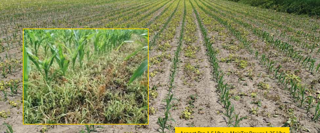
Aspect Pro 1,5 l/ha + MaisTer Power 1,25 l/ha