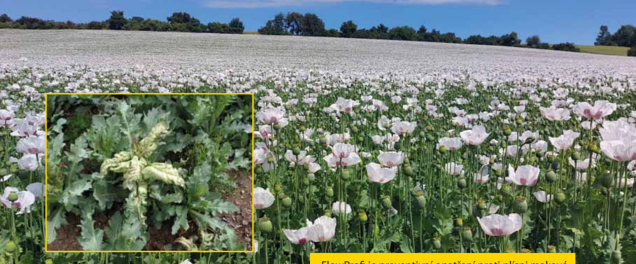
FlowProfi je preventivní opatření proti plísni makové